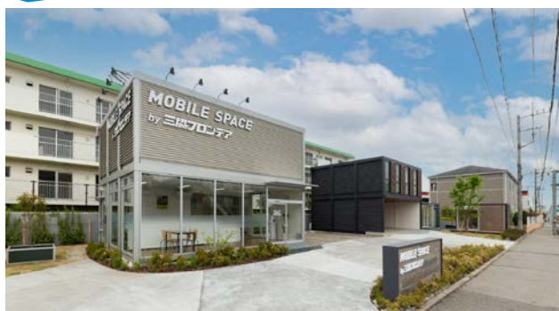
コンテナのレンタルオフィス活用事例 ユースペース川口