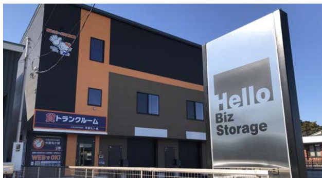
ビズストレージ複合物件事例 ハローストレージ大宮丸ヶ崎