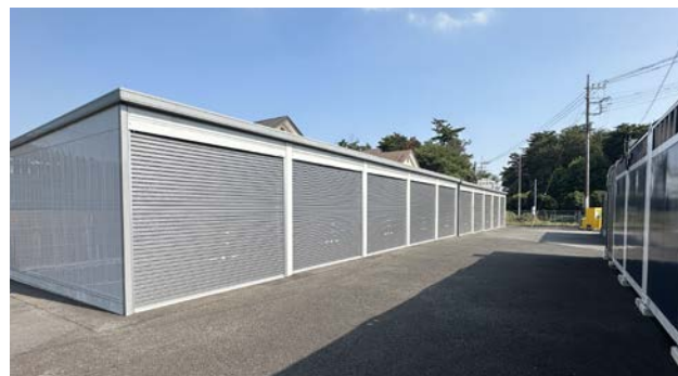
バイク、ショールーム等複合物件事例 CASTRA入間市小谷田・ ブルーストレージ小谷田第1・第3