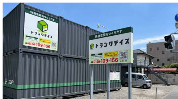
コンテナリニューアル物件事例(OPEN2014年) トランクデイズ与野